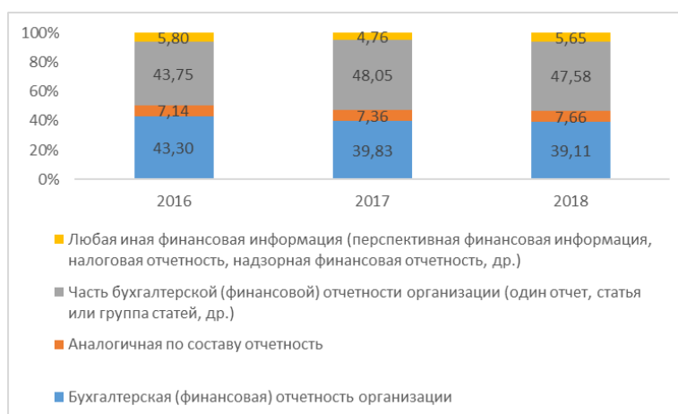
Рисунок 2 - Структура проверок по предмету аудита в 2016-18 гг.

Анализ структуры проверок по предмету аудита (рисунок 2) показал, что наибольший удельный вес у проверок части бухгалтерской отчетности (более 40%) и бухгалтерской отчетности организаций (более 39%). Наименьший процент имеют проверки любой иной финансовой информации.