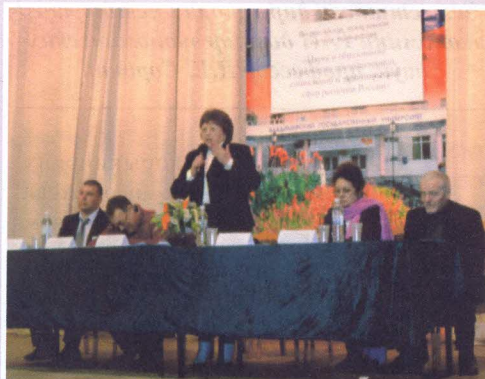
IV Всероссийские звздыкинские чтения в МИ ВЛГУ стр.2