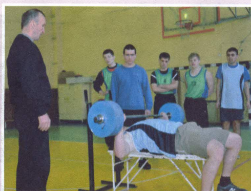
Спортивное студенчество стр. 7