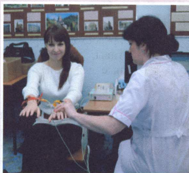
Государственная программа «здоровье» - результат есть стр. 6