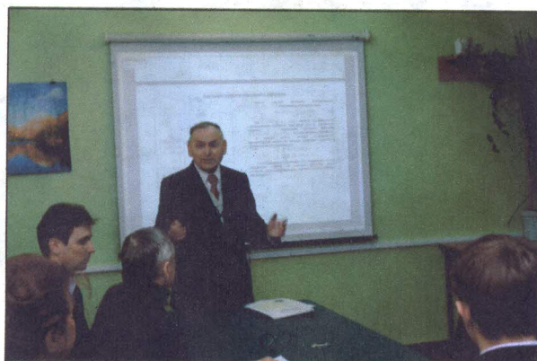
Работа в секциях

Второй этап «Зворыкинских чтений» - Всероссийская молодежная конференция состоится в Муромском институте в апреле.