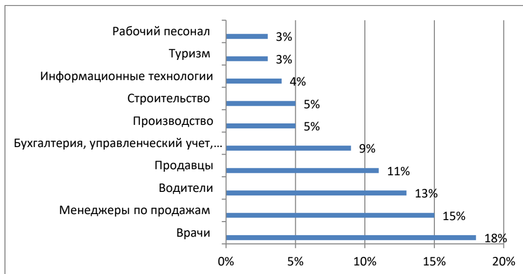
Рис. 2 - Самые востребованные профессии среди молодежи за 2020 год

На рисунке 2, согласно данным Росстата, перечислены самые востребованные профессии среди молодежи за 2020 год. На данном графике можно увидеть, что в первой пятерке по популярности оказались профессии врача, менеджера по продажам, водителя, а также продавцы и бухгалтера[2].