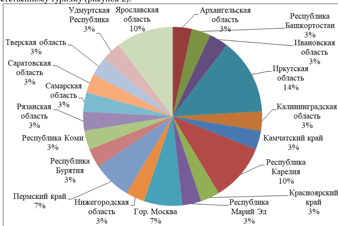
Рис. 2. Проекты СОТ в регионах РФ

Далее рассмотрим, в каких регионах были реализованы проекты, отнесенные к социально-ответственному туризму (рисунок 2):