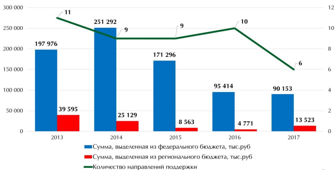
Рисунок 1 – Объем финансовой господдержки субъектов малого и среднего бизнеса во Владимирской области за период 2013-2017 гг.

В то же время объемы финансирования государственной поддержки малому и среднему бизнесу за период с 2013 по 2017 годы снизились более чем в два раза (рисунок 1). В 2013 году в целом по России из семи с половиной миллионов малых и средних предприятий и индивидуальных предпринимателей государственную поддержку получали почти 45000, а в 2016 из сопоставимого количества субъектов малого и среднего предпринимательства мерами господдержки пользовались всего 2897 [1].