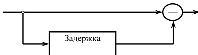
Рис. 1. Структурная схема однократной системы ЧПК

В [1-4] рассмотрено большое количество применяемых в настоящее время устройств СДЦ. Принципиально эти устройства отличаются лишь частотной характеристикой и способом реализации. Самым простым, но в то же время достаточно эффективным является устройство черезпериодной компенсации (ЧПК), структурная схема которого приведена на рис. 1.